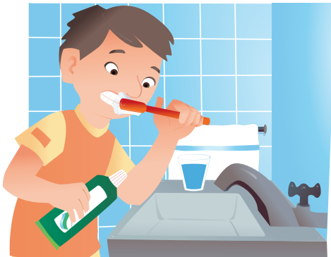
Lavarse los dientes