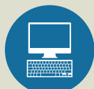
Lectura (Área priorizada)