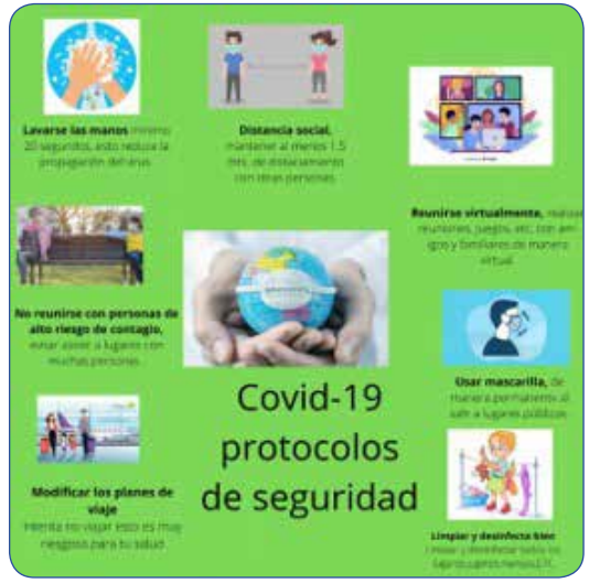
Fuente: Elaboración propia de un estudiante. Se ha tomado el ejemplo sin realizar modificaciones.

En la producción de la infografía, se observa que el estudiante ha seleccionado información pertinente sobre la bioseguridad que deben considerar los niños ante el COVID-19. Sin embargo, cabe resaltar que se observa mayor referencia a la primera lectura (texto periodístico). El artículo de opinión y la nota técnica no se evidencian en la información presentada en la infografía. Por ejemplo, el artículo de opinión proporciona información relevante sobre las razones por las cuales es importante que los niños acaten medidas de bioseguridad; mientras que la nota técnica presenta información también valiosa sobre las consideraciones que se deben tener respecto a la salud emocional de los niños durante la pandemia.