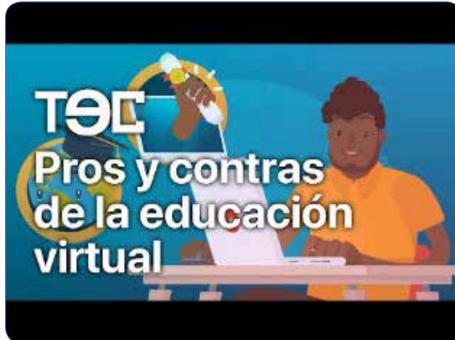
TEC (6 de mayo de 2020). Pros y contras de la educación virtual. [Video]. https://www.youtube.com/watch?v=r5bU-C1O-j4

Luego de ver el video sobre los “Pros y contras de la educación virtual”, la o el docente brindará el tiempo que considere oportuno para que las y los estudiantes respondan las preguntas sobre el video observado.