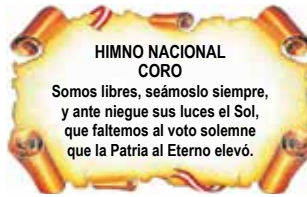
CORO DEL HIMNO NACIONAL