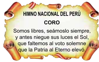
CORO DEL HIMNO NACIONAL