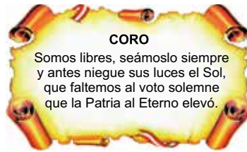
CORO DEL HIMNO NACIONAL