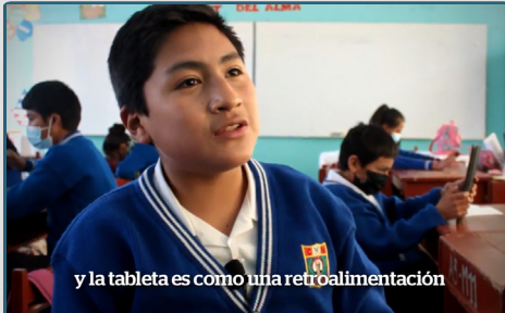
y la tableta es como una retroalimentación

El proyecto promueve el aprendizaje de manera autónoma en los estudiantes de 1ro de secundaria, porque les permite comprender, recordar y fortalecer sus competencias en el área de matemática. En el aula y con la guía del docente se enfatiza el proceso de retroalimentación y evaluación formativa en base a la ficha trabajada por los estudiantes desde la plataforma virtual.